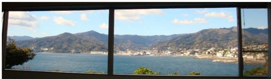
リビングからの眺め

★ジャグジーバス、フィットネスルーム、多目的ルーム ゲストルーム2室(有料)が共用設備にあります。