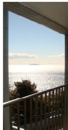
バルコニーから初島を望む